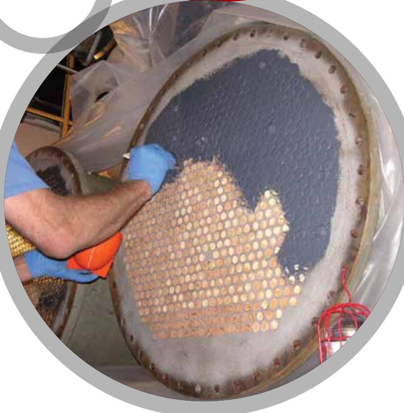
Intercambiadores de calor