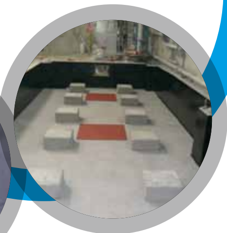
Áreas de contención