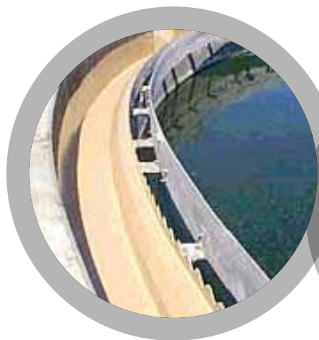
Depósitos de decantación